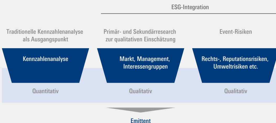
Abb. 2: Bottom-up-Analyse – erste Stufe: Emittentenauswahl

Bitte beachten Sie die Rechtlichen Hinweise auf Seite 7.