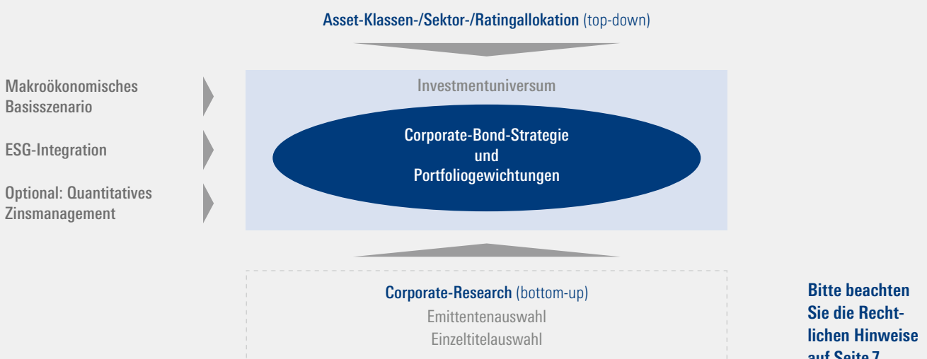
Abb. 1: Kombiniertes Investmentprozess als Schlüssel zum robusten Zusatzertrag

Das Anlageuniversum besteht aus internationalen, in Euro denominierten Investmentgrade-Anleihen. Aus diesem Universum filtern wir die besten Unternehmen und Titel für das Corporate-Bond-Portfolio heraus.