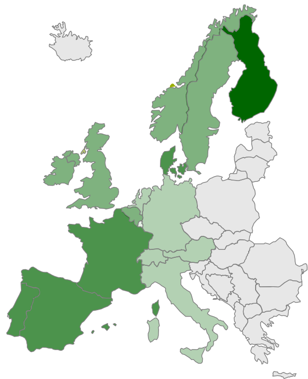
Abb. 4: Transformations-Scoring europäischer Länder

Basis: Unternehmen im MSCI World Index; je grüner das Land, umso höher fällt die mittlere Transformationsleistung aus; Stand: 31.10.2025