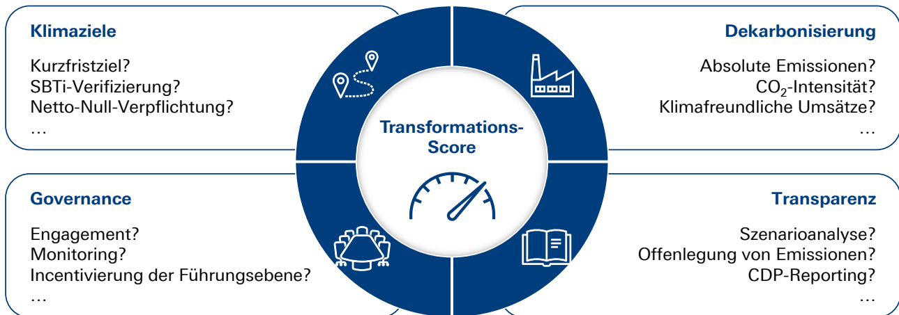
Abb. 1: Kategorien des Transformations-Scorings und ausgewählte Indikatoren

Stand: 31.10.2025; SBTi = Science Based Targets initiative, CDP = Carbon Disclosure Project