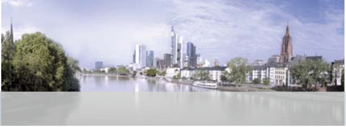
Blick auf die Frankfurter Skyline