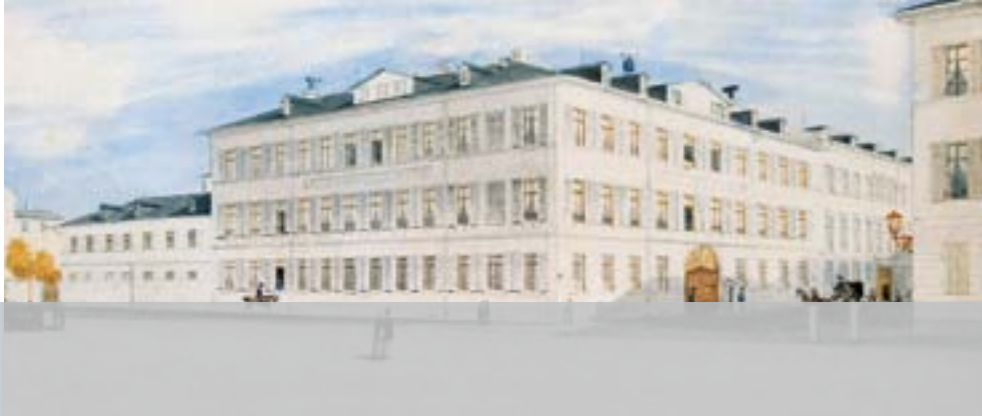
Neue Mainzer Straße 42–44/Große Gallusstraße 18 im Jahr 1849