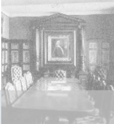
Sitzungssaal im Bankhaus Metzler um 1900