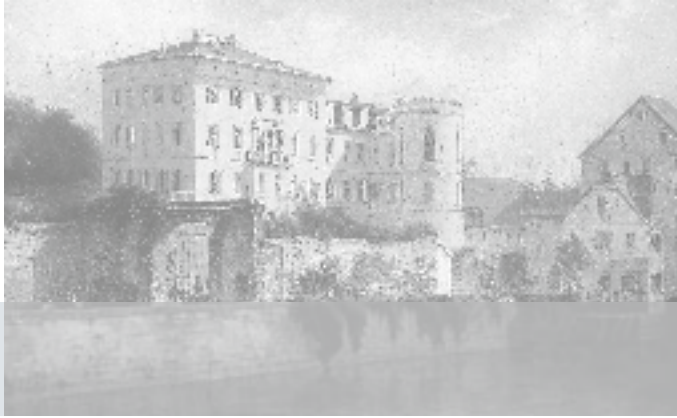
Haus Metzler in Bonames auf einem Gemälde von Carl Morgenstern, 1865